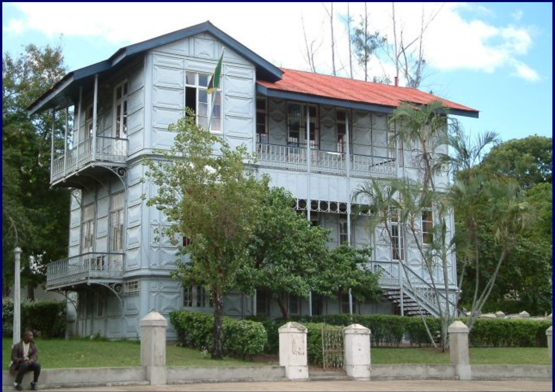
Casa de Ferro - Maputo